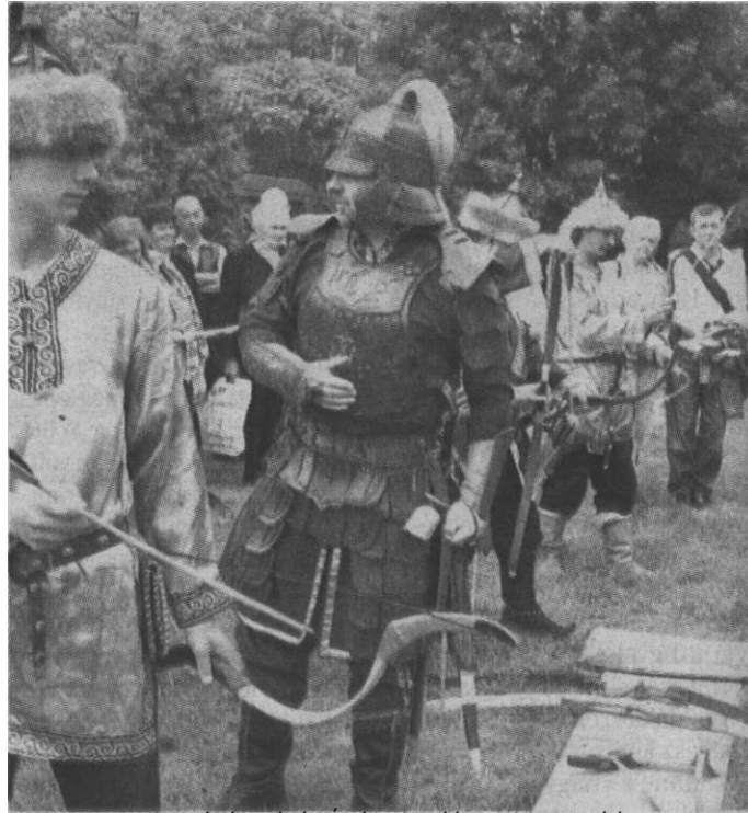
Sokan nézték a rétsági Arpád Egylet íjászainak bemutatóját